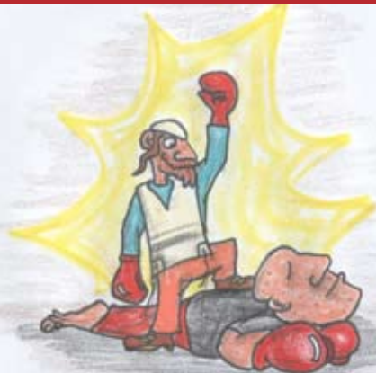
אם האחד הוא בעצלות וכבדות ינוצח בקל ויפול גם הוא גיבור יותר מחברו