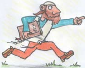
ככה ממש בניצחון היצר אי אפשר לנצחו בעצלות וכבדות הנמשכות מעצבות וטמטום הלב כאבן

"כגון שני אנשים המתאבקים זה עם זה להפיל זה את זה. הנה אם האחד הוא בעצלות וכבדות ינוצח בקל ויפול גם אם הוא גבור יותר מחבירו. ככה ממש